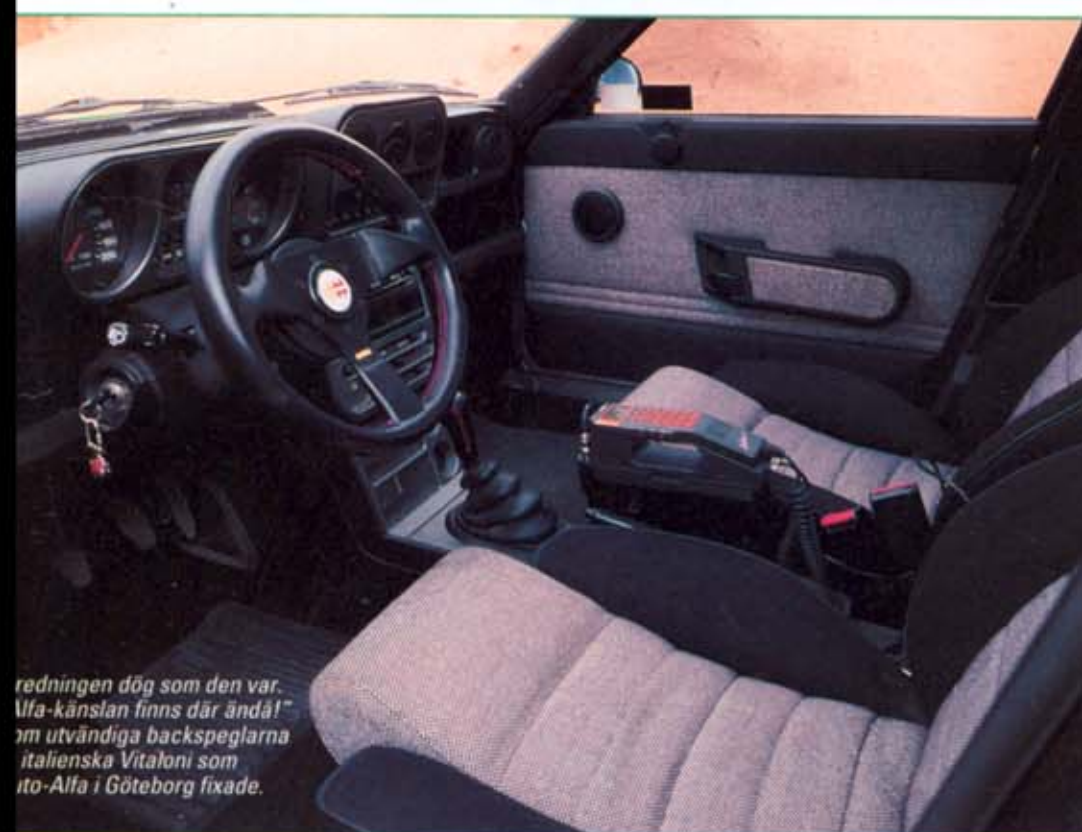
redningen dög som den var. Alfa-känslan finns där ändå! Om utvändiga backspeglarna italienska Vitaloni som ito-Alfa i Göteborg fixade.